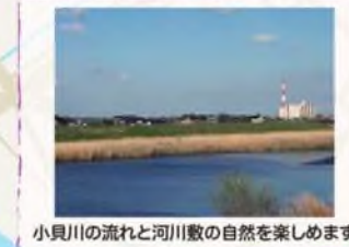
小貝川の流れと河川敷の自然を楽しめます