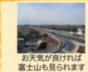
お天気が良ければ富士山も見られます