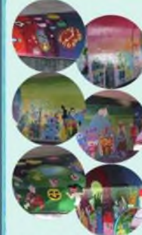
子ども達の自由な発想で描かれた壁画がたくさん!全部みつかるといいな?