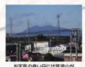
お天気のよい日には筑波山がくっきりと見られます