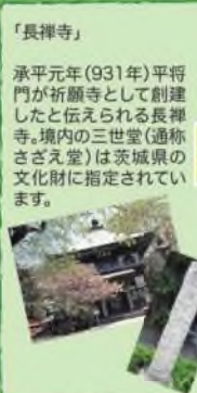
「長禅寺」 承平元年(931年)平将門が祈願寺として創建したと伝えられる長禅寺。境内の三世堂(通称さざえ堂)は茨城県の文化財に指定されています。 「天満宮の牛」 学問の神様、菅原道真公を祀る井野天満神社には、座牛と呼ばれる牛の像があります。道真公が丑年生まれである「丑の日」に亡くなった「牛」の魂を祀ったと伝わる。牛の像を引く牛が、座り込んだ場所にお社を建てた、などのいわれがあり、「撫でると賢くなる」と合格祈願などに多くの人々が訪れます。