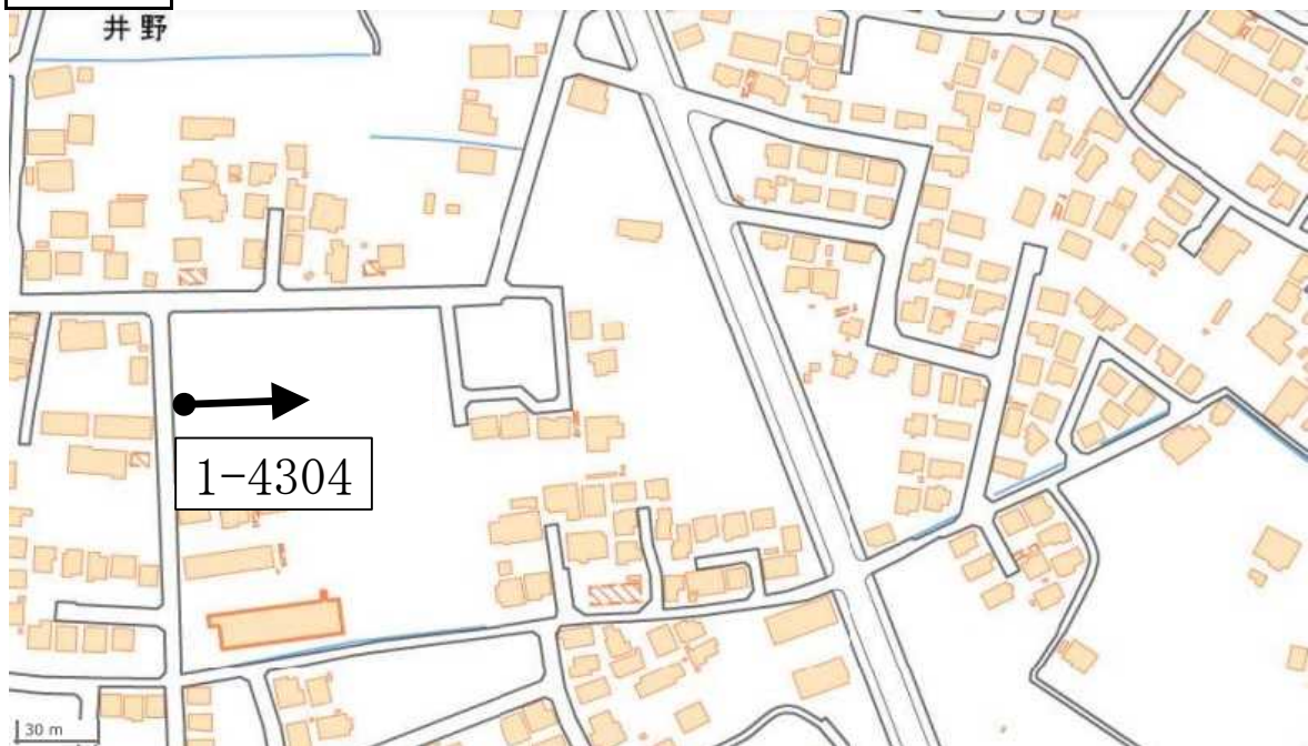
地理院地図を加工して作成