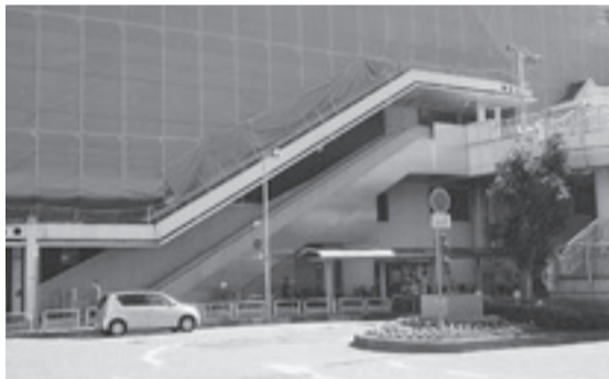
取手駅西口バス停周辺