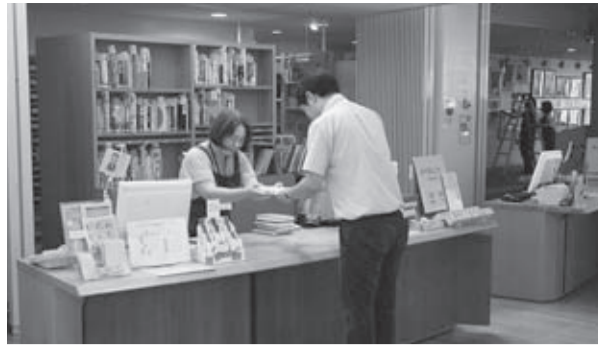
ふじしろ図書館の受付

問 図書館法等で、図書館は教育文化の基礎となる施設として、民主主義の根幹を支える住民の学ぶ権利、知る権利を保障するのふさわしい体制を整えることが義務付けられている。それにも関わらず、窓口業務の民間委託を進める理由は、 教育部長 平成23年5月に作った公共施設マネジメント白書では、30年を経過している施設が半数近くあった。あと20年で建て替えが必要なることを踏まえて、今年、行政経営改革プランを作成した。そこで効率化や業務の見直しを行わないと、今後の維持ができなくなるので、できることは一部民間委託ということになった。