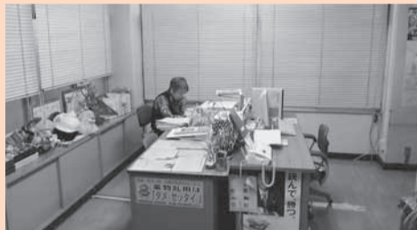
青少年の健全育成・指導推進のための施設