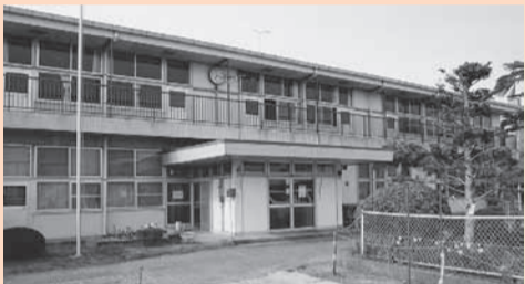
発達に遅れや偏りがある子どもの福祉増進のための施設