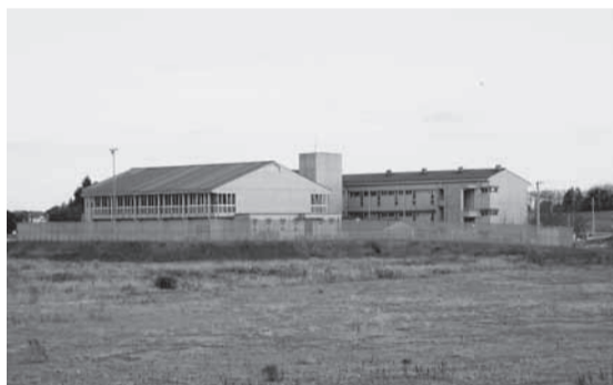
高井小学校 (左が体育館)

これらを勘案して、試行 的に、高井小、取手一中、 藤代中、藤代南中の体育施 設を夜10時まで利用時間を 延長したいと考えている。 時期は、7月ごろを予定。 電力供給の問題、地域住 民からの苦情等があった場 合には、再度、検討する。