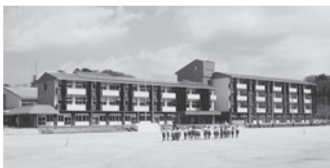
江戸川学園取手小学校(旧野々井中学校)

井野小と旧取手一中はまだ決まっていない状況。公共施設の土地をどのように活用するか、コンサルと一緒に方策を考えていく予算を計上している。