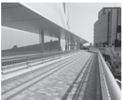
4月に開通した取手駅西口歩行者デッキ