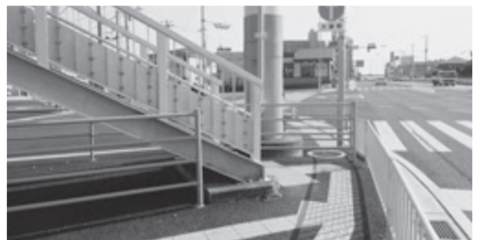
白山交差点と歩道橋(上り)

都市整備部長 白山交差点の安全確保について検討を進めてきたが、1月に国から安全対策案が示された。上り線の横断歩道橋の階段