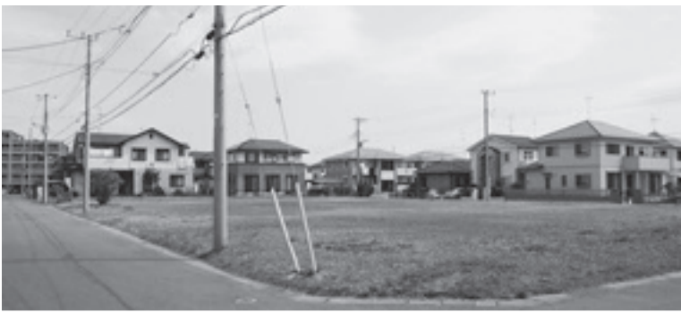
藤代駅南口第2公園予定地(藤代南)

建設部長 街区公園として整備していきたい。整備手法は、市民と協働による公園整備事業で行う。地区の皆さんと検討会を設けて整備を進め、地区に親しまれる公園となるようにしたいと考えている。