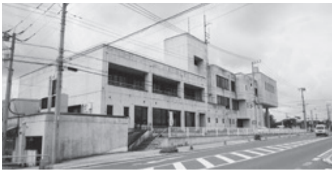
消防共同指令センター本部が設置される水戸市役所内原庁舎

関戸議員：消防隊員3名をセンターに派遣して、消防機能は維持されるのか。差し迫る危機から市民を守る消防機能の確保にこそお金を投入すべき。反対。