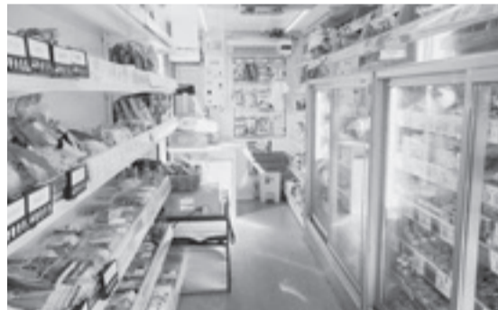
移動販売車内の様子

問 総務省は要望を受けて、厚生労働省に対して、受給資格の見直しについてあっせんを行った。今回の緩和はそういう影響もあった。議会も以前、国に意見を出したので、市も国に改善を要望してほしい。 答 国の動向を見るが、今の状況で行きたい。 問 スーパーの移動販売における国の補助は雇用対策によるものか。 まちづくり振興部次長 国の雇用対策による3カ年継続事業であり、補助には条件として、3年後に自立して進められる事業であることがある。 問 雇用が大きな問題でなくなれば、移動販売はなくなってしまうということなのか。 市長 買い物に困難な方々に対する移動販売については、国の補助事業が完了した後も独自の財源で続けなければならぬ。重要な事業として残していくつもりである。 問 移動販売車について、荷台まで3段階ほど階段があり、高齢者にはつらい。また両側に商品の棚があるため、通路は一人が歩けるほどで戻ることができなく買いつらいという意見を聞いた。この意見を取り入れた車にすべきではないか。 まちづくり振興部次長 車は低床タイプを採用している。階段の意見は聞いているが、現状の対応としては運転手が介助している。通路が狭い部分は、品数を多くということになると、今の車でないとは厳しいものがある。また、道路が狭いところもあり、これ以上大きい車での対応は難しい。