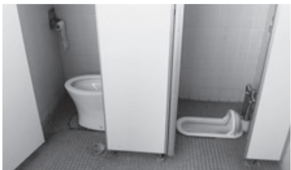
改修が決まった藤代小のトイレ

結城議員：歩行者デッキについてはいろいろな観点から反対してきたが、できた歩行者デッキを市民が安全に通るために条例は必要である。賛成。