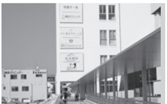
取手iセンタービル(医療モール)