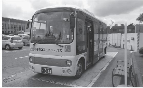
取手市コミュニティバス「ことバス」