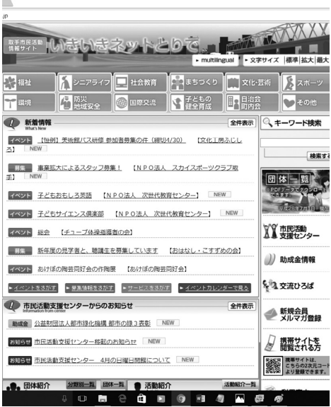
市民活動情報サイト「いきいきネットとりで」