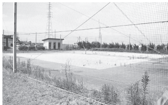
久賀テニスコート

年以上前からテニスコートは使用していない。子どもたちの安全を第一に考えての対応と評価する。賛成。