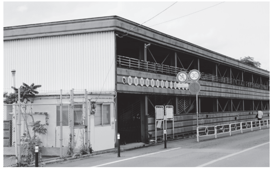
取手駅東第1自転車駐輪場