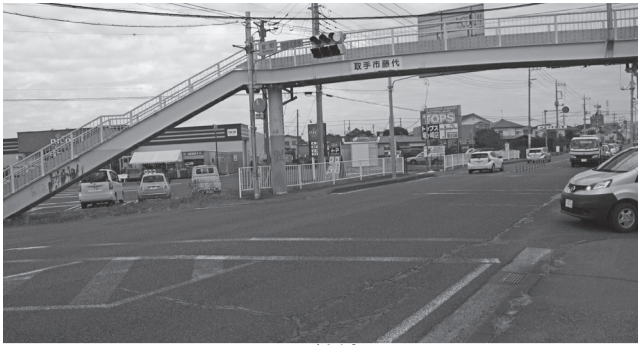
白線の消えかかった交差点(蔵前交差点)