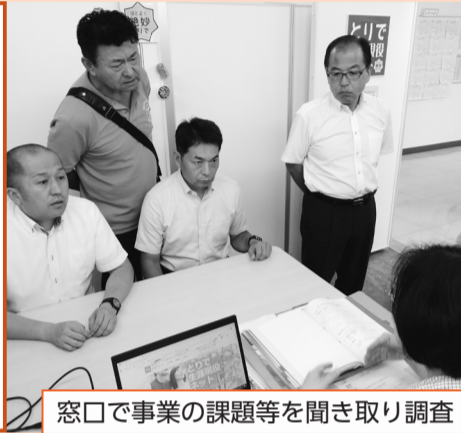
窓口で事業の課題等を聞き取り調査

建設経済常任委員会は7月25日、取手駅西口前りボンとりで5階で、シニア世代の皆さんの経験を生かし「就業」「起業」「地域参画」へ向けた総合相談窓口等の様々な支援を行っている「とりで生涯現役ネット」を視察しました。市の担当課職員から事業の概要についての説明を、とりで生涯現役ネットの事業統括員からは事業の経緯と課題の説明を受けました。「限られた予算の中で、より多くの市民の方に利用していただくにはどうしたらよいか」、「もっと市民の方に知ってもらうには」等、課題に対する意見が交わされ、事業に対する理解を一層深めました。