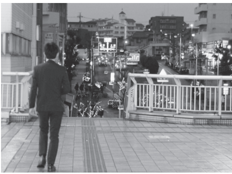
取手駅西口のデッキから国道6号方面

安全運行や駅の構造といった制限がある中で計画検討。東西自由通路の必要性は認識。再開発事業の推移を見守りながら、しかるべきタイミングで検討に着手。 【その他の質問】生活保護手続き・環境衛生推進事業・職員倫理条例・空き家対策・広域合併