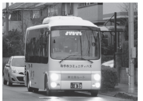
桜が丘地区を走るコミュニティバス

問 地域の声を直接聞いていただきたい。都市整備部長 いかに使っていただけか地域の皆さま