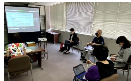
前回の意見交換会の会議室