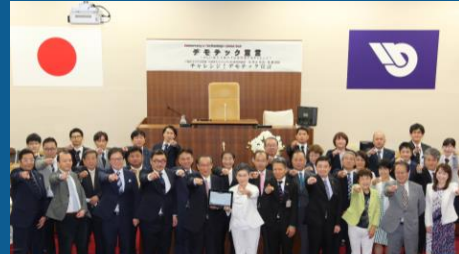
デモテック宣言セレモニー

官・民・学連携協定で、議会のさらなるICT化による新しい民主主義の手法構築に向けてチャレンジ