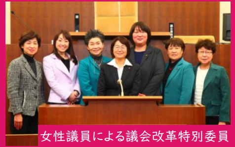
女性議員による議会改革特別委員

平成30年から会議規則の欠席事由に「出産」を明記。女性の政治参画を先駆けて進めています