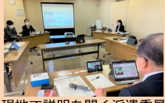
現地で説明を聞く派遣委員

建設経済常任委員会がデマンド交通について調査するため、山形県南陽市、福岡県嘉麻市、三重県三重郡菰野町へ、委員会の代表2~3名を派遣しました。