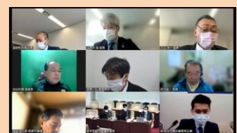
様々な場所から議員や職員が視察に参加

さらに今回の委員派遣では、Zoomを活用し、現地に赴いた委員以外の建設経済常任委員、委員外議員、取手市の関係部署職員もオンラインで視察に参加。現地とオンラインをつないだハイブリッドな取り組みを実施しました。