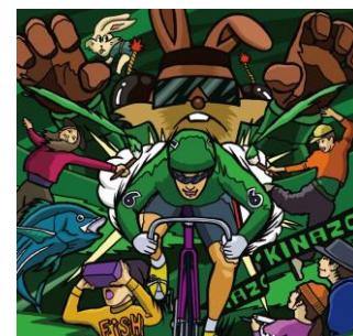
令和5年11月19日に開催されたサイクルアートフェスティバルのチラン(抜粋)

当てにすることは健全な財政運営にはならない。また、まちづくりの観点に立ってみても、本市のまちづくりの基本方針である、ぬくもりと安らぎに満ち、共に活力を育むまち取手とは相いれない。反対。