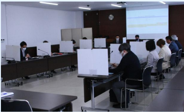
投票の秘密を保持するためパーティションを置き、 タブレット端末を使って投票する委員

ご自宅等からパソコンやスマートフォンで参加できます。 事前登録が 必須 です。 右上の二次元コードから登録をお願いします。