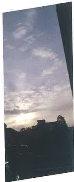
再開発の掘り起こしが進む港区三田で

E-mail info@kukaku.org ホームページ「区画整理・再開発」で検索 http://kukaku.org/