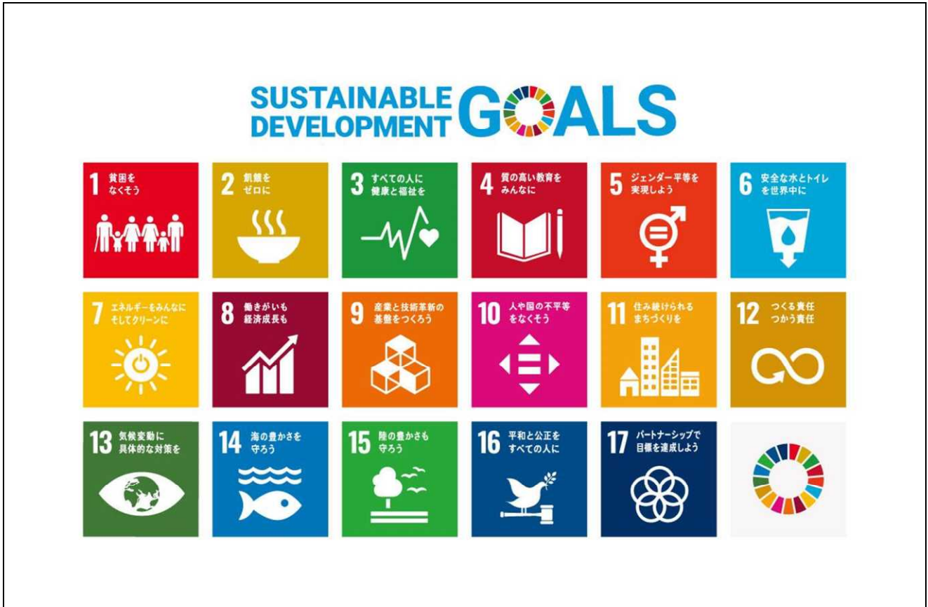
図表 1 SDGs ロゴ