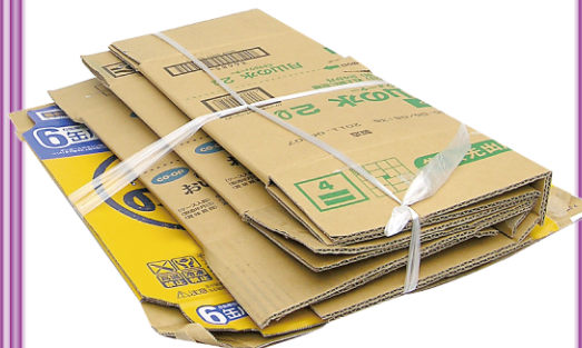
ひもで十文字にしる