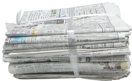
ひもで十文字にしる