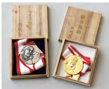
国体総合優勝のメダル（右）とスポーツ優秀賞のメダル（左）