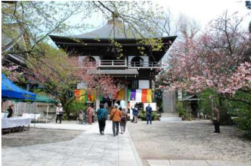
内部公開時の茨城県指定文化財「長禅寺三世堂」

「さざえ堂」様式の建物は、長禅寺のほかには、群馬県太田市の曹源寺、埼玉県本庄市の成身院、福島県会津若松市の旧正宗寺、青森県弘前市の蘭庭院の計5か所しかなく、大変に珍しいものです。