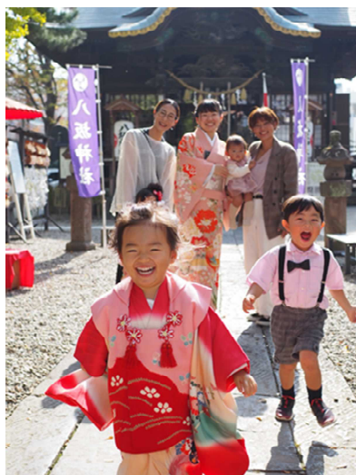
第 11 回フォトコンテスト最優秀賞「七五三」

: 入賞作品の展示期間は令和 7 年 3 月 24 日 (月) から 3 月 28 日 (金) まで藤代庁舎及び令和 7 年 4 月 2 日 (水) から 4 月 8 日 (火) まで取手駅ギャラリーロードで展示される予定です。