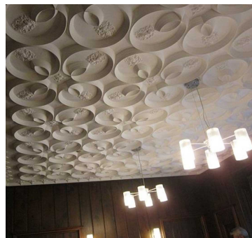
意匠が見事な食堂の天井