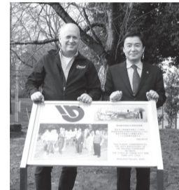
ユーバ市長ショーン・ハリス氏(左側)