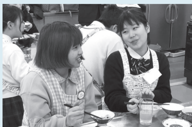
試食しながら談笑する参加者

本語と身振りで伝えました。調理が終わると試食しながら、お互いの文化への理解を深めました。◎取手市国際交流協会は、交流イベントや在住外国人向けの日本語教室などを行っています。