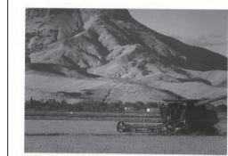
The Sutter Buttes The Sutter Buttes are a small circle of eroded volcanic lava domes that rise as buttes above the flat plains of the Sacramento Valley in Sutter County. The Sutter Buttes are 2,500 feet tall, 10 miles in diameter, and are actually low to be the smallest mountain range in the world. The Buttes are very beautiful, especially in the spring. We were able to hike the Sutter Buttes in 4th grade. The mountain height is so high it hurt my legs, but it was worth it to see the view from up top. Sasha Ghajar Ariana Karpene Grade 7

市内生徒とユーバ市生徒を対象に、写真による交流事業を実施しています。今年で5年目となるこの事業では、「自分のまちの好きな風景」の写真とメッセージを募集し、お互いの作品を交換・展示しています。