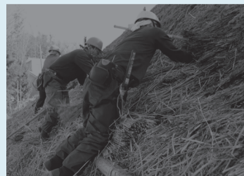
新しいかやを差し込む様子

かやは静岡県御殿場市から運ばれました。北側では足場の丸太を組み、職人が、古くなったかやを抜き取り、新しいかやを差し込んでいきました。3月中旬に、ふき替えを終え4月3日(金)から公開を再開する予定です。