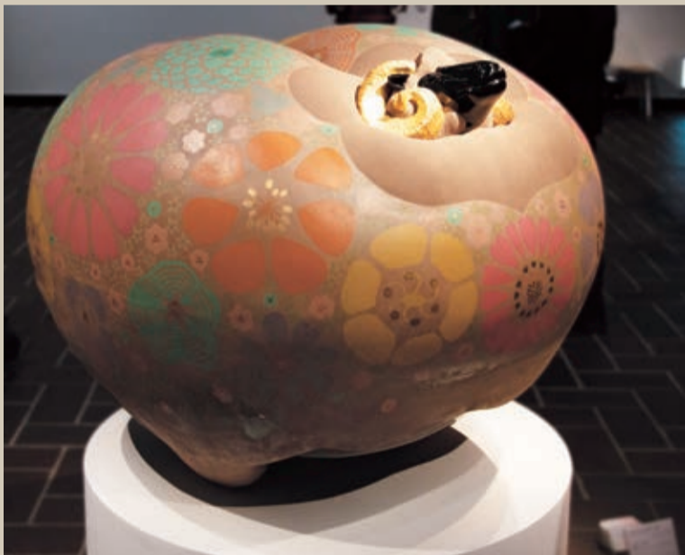
あなたのことがだいすき 工芸(漆芸) (漆・高さ92cm×幅125cm×奥行125cm)