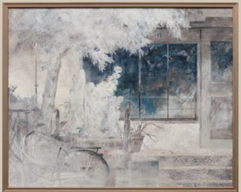
boundaries 日本画 (土佐麻紙、膠、岩絵具、銀箔、金泥、銀泥) ・高さ181.8cm×幅227.3cm)

なお、取手ウェルネスプラザには、県学生寮の頃からあった桜が今も残されています。ぜひこの機会に取手駅周辺で、50年という取手の歴史を感じ取ってみたいはいかがでしょうか。