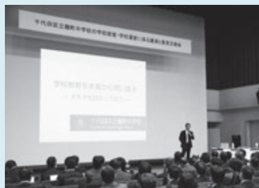
「全員担任制」を導入している先進校の講演を聞く小中学校教員

工藤校長は、全員担任制の効果について説明。その後、同氏を交えて意見交換会を行いました。