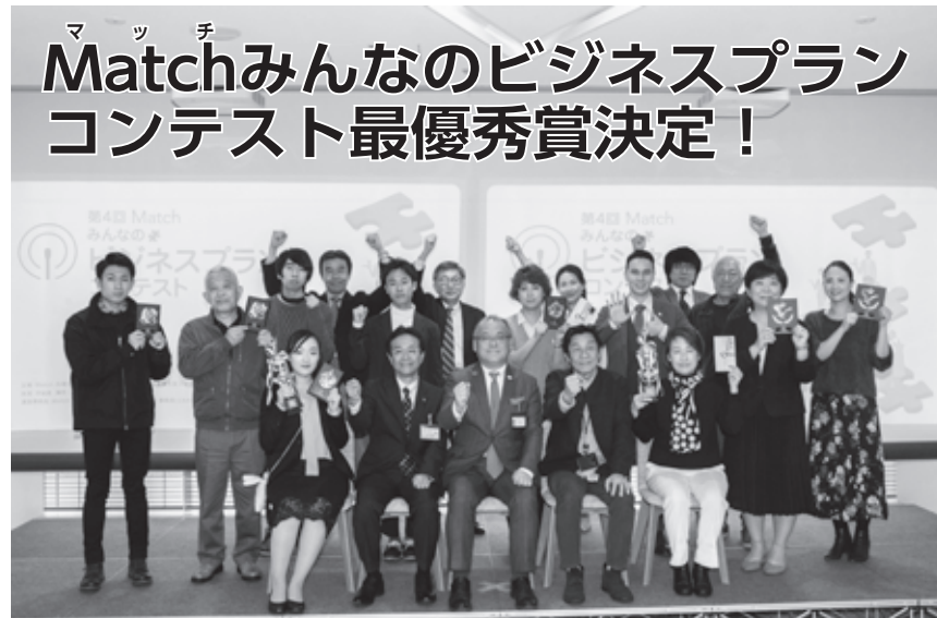
問 Match広域連携推進本部 ☎0120-737-779