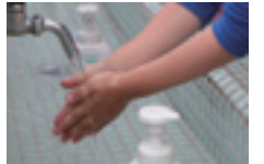
調理や配膳、食事の前にはよく手を洗いましょう