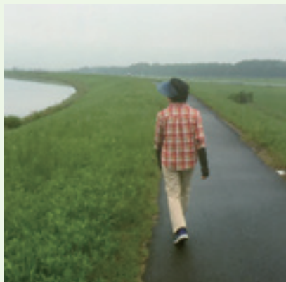
「私は早朝散歩をやっています」