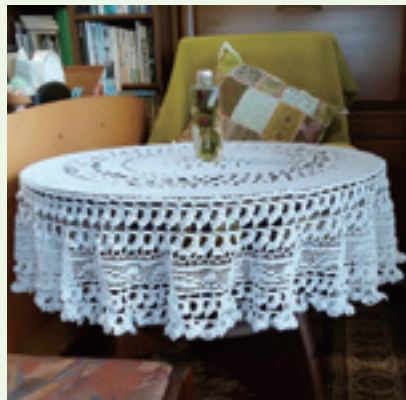
「私は編み物をやっています」

自粛期間中に体力を落とさないように、早朝に小貝川河川敷を散歩しています。最近若い人がジョギングや釣りをしていたり、自転車やボートに乗っている人がいたり、少しにぎやかになってきました。