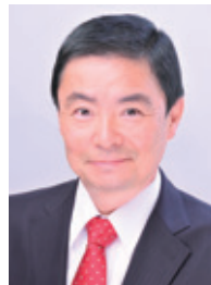
市長メッセージ 動画 公開中！

市制施行50周年を迎え、取手市は誰もが生涯を通じて豊かで健康に安心して暮らせる社会を実現していきたいと考えております。ご協力のほど、お願い申し上げます。