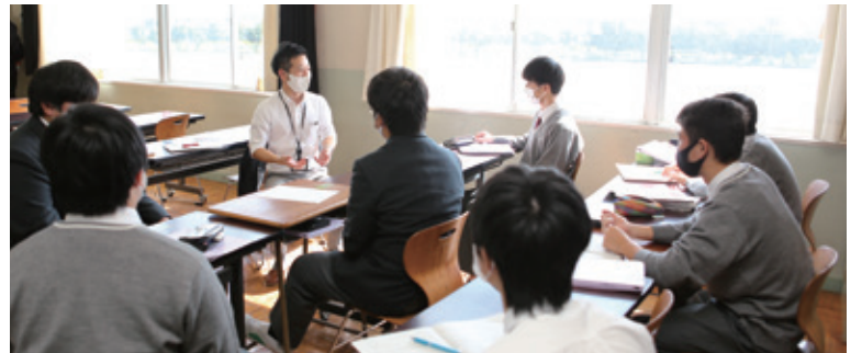
社会人からアドバイス!

10月24日に行われた公開授業では、茨城南青年会議所の会員と市職員約30人が、アドバイザーとして参加しました。生徒たちは、社会人から地域の課題や行政の考えなどを聞きながら話し合いを進めました。「資料を見ても分からなかったことが聞けた」「自分の考え方が広がった」などの声が上がりました。