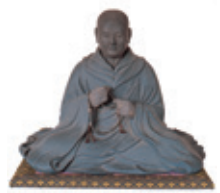
木造如信上人座像(願入寺所蔵・大洗町指定文化財)