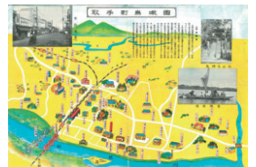
昭和30年代初め 取手町鳥瞰図(取手市教育委員会所蔵)

◆日時 10月2日(土)～12月12日(日) 9:00～17:00(入館は16:30まで) ◆休館日 月曜日(10月4日、11月1日を除く) ◆会場 埋蔵文化財センター(吉田383) ◎展示室への入場を制限する場合があります。