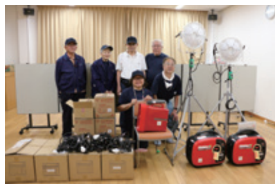
新取手自治会自主防災会