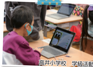
高井小学校 学級活動

器械体操や球技などの授業の際には、お互いにフォームや試合中の様子を動画で撮影します。動画を視聴し、上達のためにどこを改善すべきかを考え、アドバイスし合います。