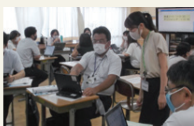
昨年8月には、外部講師を招いた研修を実施しました

学校間・教員間で、タブレット端末を活用した授業の内容に差が出ないよう、研修やマニュアルの配布を行っています。また、各学校ごとの独自の取り組みの中で、先進的なものを紹介し合い、市全体でのレベルアップを図っています。