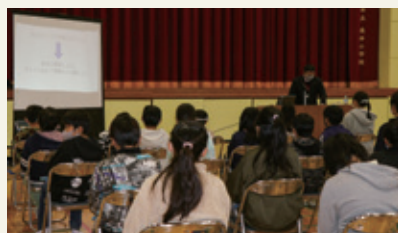
高井小学校が開催した「インターネット安全教室」

セキュリティの重要性や、著作権・肖像権、インターネットでのマナーなど、トラブルや犯罪から児童・生徒を守るために、情報モラルの育成に努めています。学年ごとに段階を踏み、市が定めたガイドラインに沿って取り組んでいます。