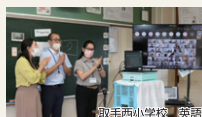
取手西小学校 英語

新型コロナウイルス感染症の感染拡大に伴い、昨年9月の一部授業はオンラインで行いました。画面越しに顔を合わせることで、教員が児童・生徒の学習をサポートしやすくなりました。