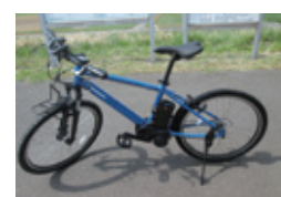
電動アシスト付き