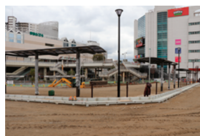
バス停留所 3・4 付近