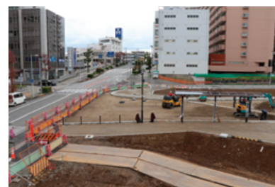
ロータリー出入り口(はなのき通り側)