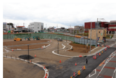
ロータリー出入り口(取手ウェルネスプラザ側)