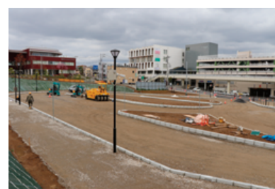
一般車乗降場(手前)、タクシー乗り場(奥)