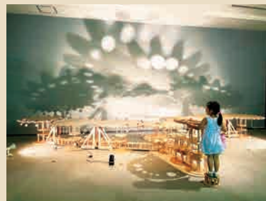
「歯車のオルゴール」

木琴や歯車を取り入れ、見て、聴いて、触れて楽しめる作品を主に制作しています。大切にしているのは作品が「コミュニケーションの種」になること。作品を通してその場にいる人同士のコミュニケーションが生まれ、空間が楽しくなる。その空間自体も作品と考えているので、個展や大型商業施設にある作品を多くの人に体験してほしいです。