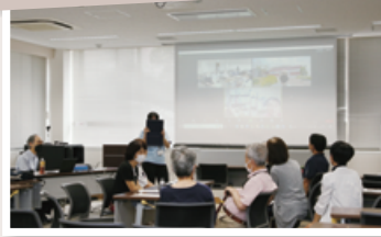
リアルとオンラインを融合

開催日 第2火曜日(予約制) 会場 取手ウェルネスプラザか オンライン (Zoom) 対象 認知症、MCI(軽度認知障害) と診断された方、その家族 ☎ 高齢福祉課 ☎内線1308