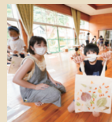
染色ワークショップ

初めは羊毛を使って雑貨などを制作していました。そこから自分で素材の着色・加工をすることにも興味を持ち、好奇心の赴くままに創作の幅を広げています。また、子ども向けの染色ワークショップも活動の柱です。子どもたちの発想力・想像力には度々驚かされますね。大きな可能性を見せられると、私自身の創作活動の刺激にもなります。