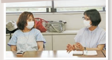
体験を共有(藤代地区)

【参加者の声】▶周囲に介護について相談できる人がいないので、非常に参考になる▶経験者から「知恵」をもらえる▶介護家族の会で話したことがきっかけで、新たな病気を発見し早めの対応ができた