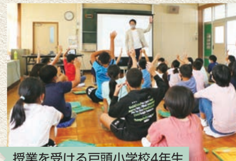
授業を受ける戸頭小学校4年生

市は、未来を担う子どもたちが持続可能な未来をつくるための知恵や価値観を育む、取手市「サステナブル学習プロジェクト」をスタートしました。今年度は戸頭小学校と戸頭中学校をモデル校に指定し、地球温暖化による気候変動への対応を題材に、「とりでおんだんかマスター トライアル2022」を実施します。 令和7年度までの4年間で市内公立の全小・中学校で実施していきます。