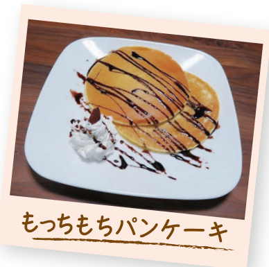
もちもちパンケーキ

取手市産のコシヒカリ100%で作った米粉です。きめ細かく製粉してあるので、お菓子やパン作りに最適です。