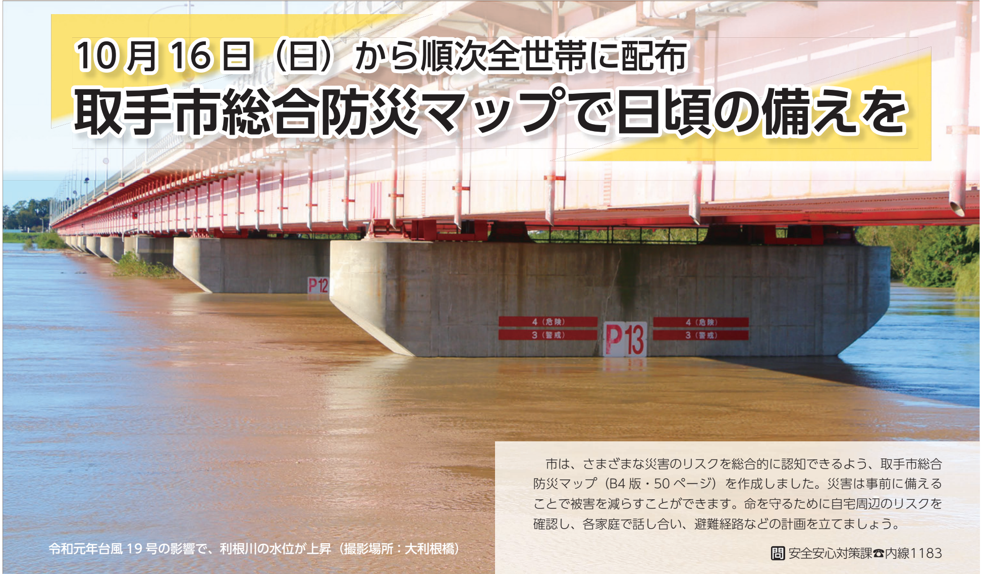
令和元年台風19号の影響で、利根川の水位が上昇（撮影場所：大利根橋）

市は、さまざまな災害のリスクを総合的に認知できるよう、取手市総合防災マップ（B4版・50ページ）を作成しました。災害は事前に備えることで被害を減らすことができます。命を守るために自宅周辺のリスクを確認し、各家庭で話し合い、避難経路などの計画を立てましょう。