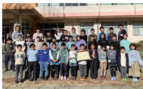
※(公財)げんでんふれあい茨城財団が県内の小・中・高等学校の科学技術に関する優れた調査などに助成しています

取手西小学校の4年生39人が、げんでん科学技術振興事業(※)小学校の部で大賞を受賞しました。同校は、校内に設置された生ごみ処理機からできた堆肥を利用して、植物の発育への影響を観察し、まとめました。児童たちは「給食の残りを肥料にする取り組みは資源が循環し地球に優しいですが、まず給食を残さず食べることが一番大切だと思いました」と話しました。