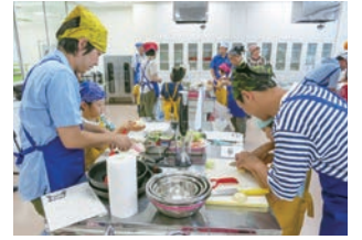
おとう飯料理動画

また、内閣府男女共同参画局が実施する「“おとう飯” 始めよう」キャンペーンのサポーターとなり、あまり料理経験がない方でも手間をかけずに作れるメニュー「おとう飯」を3品考案しました。そのレシピと市長が料理に挑戦する動画を、市ホームページで公開しています。