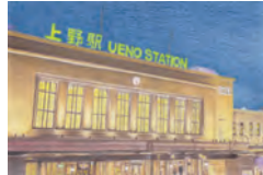
ヒロツチさん 「最寄り駅」