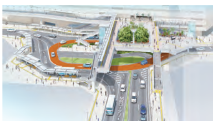
取手駅西口交通広場完成イメージ