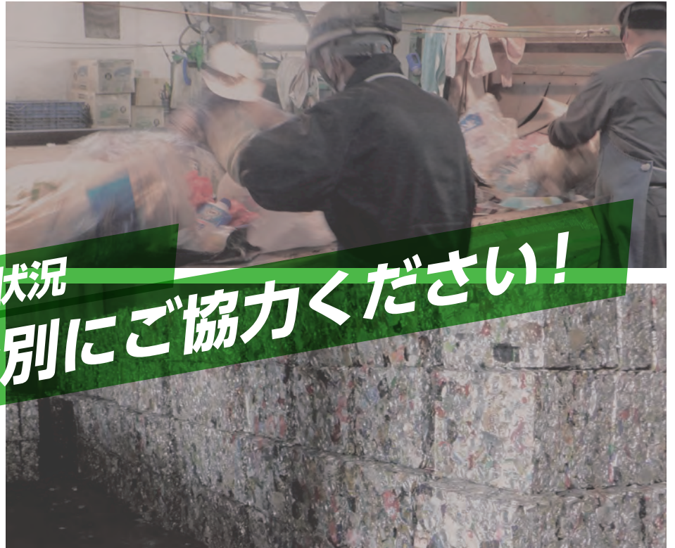
(写真上) 不燃ごみを手で選別しています。危険なものを取り除いた後、機械を使って再利用できるものと焼却するものに分けます。(写真下) 圧縮した空き缶のブロック。空き缶は再利用できるため、ブロック状に圧縮した後リサイクル業者に引き渡します。

可燃ごみを貯めているピット。ごみの増加により、ごみピットの容量が限界に達しているため、今後ごみの処分ができなくなる恐れがあります。