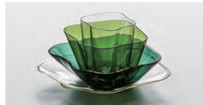
アルヴァ&アイノ・アアルト 「アアルト・フラワー [3031,3032,3033,3034]」 1939年 コレクション・カッコネン