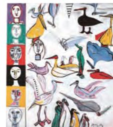
猪熊弦一郎《飛び日のよるこび》1993年 丸亀市猪熊弦一郎現代美術館蔵 ©公益財団法人ミモカ美術振興財団