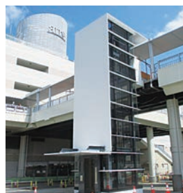
新しいエレベーター (6月19日時点)