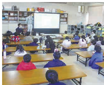
小学校で防災出前講座