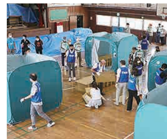
自主防災会との防災訓練

※指定された日時に、それぞれの場所で地震から身を守るための三つの安全確保行動(①姿勢を低く、②頭を守って、③揺れが収まるまでじっとする)を行う訓練です。