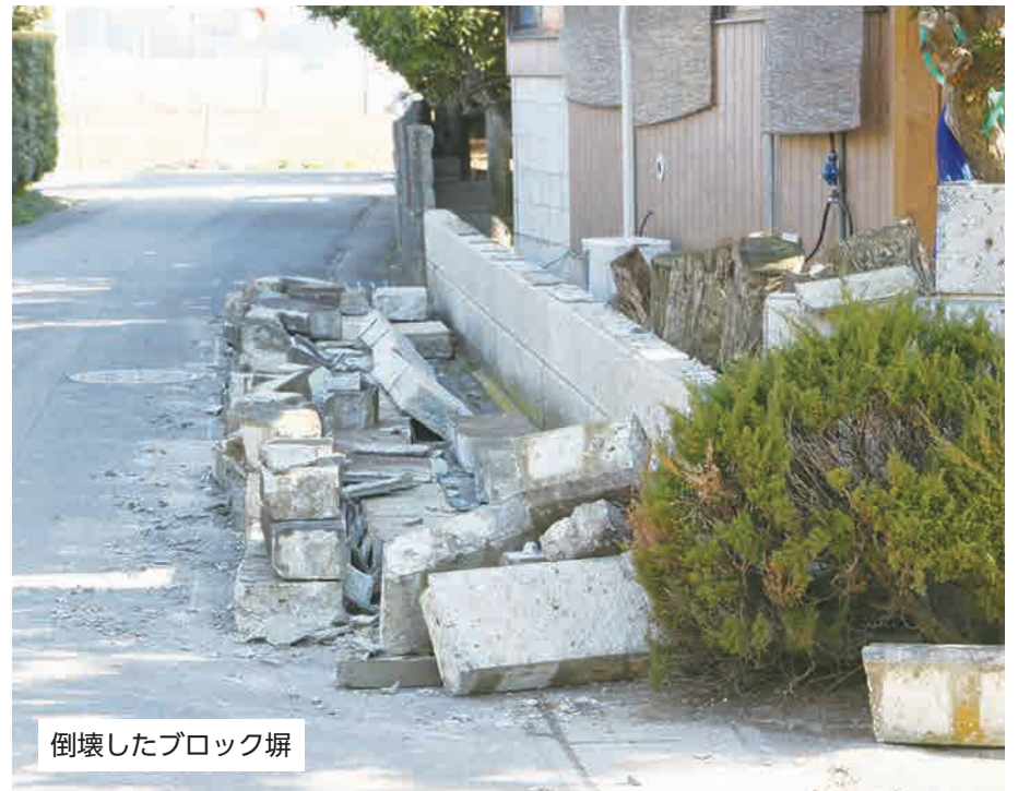
倒壊したブロック塀

令和5年9月1日で、関東大震災から100年の節目を迎えます。平成23年には東日本大震災が発生し、取手市でも写真のような道路の陥没やブロック塀の倒壊などの被害を受けました。しかし、時間の経過とともに、被害を受けた記憶は薄れがちになります。地震は、いつ、どこで起こるか分かりません。今回の特集では、過去の大地震で受けた県内や市内の被害状況を振り返りつつ、今後起きると想定されている地震や日頃の備えなどを紹介します。今一度、地震への備えを見直しましょう。