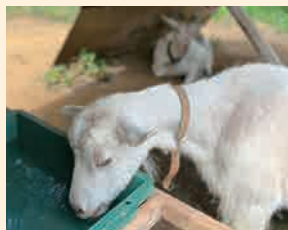
暑い日、ヤギもしっかり水分補給をしています

このヤギたちは、東京芸大の学生や教職員、地域住民の有志、TAPで構成されるチーム「ヤギの目」のメンバー。「ヤギの目」は、日々のヤギの飼育や環境整備活動への関わりを通じて、さまざまな立場の人やヤギとともに、新しい芸術活動や地域のあり方を考えていく活動をしています。月1回以上参加できる人であれば、誰でも参加できます。