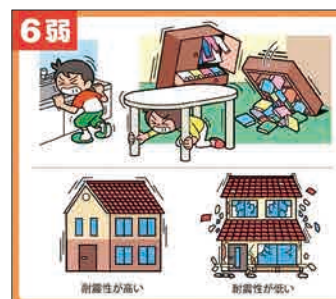
震度6弱での揺れの状況

茨城県で最も影響がある地震が発生した場合、取手市では震度6弱(立っていることが困難で、固定していない家具の大部分が移動したり倒れる程度)の揺れが予想されます。