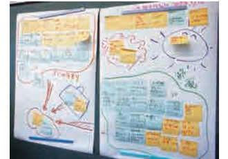
とがしら 戸頭中学校で行われた、「サステナブル学習プロジェクト」の取り組みの一つ、「とりでおんだんかマスタートライアル2022」の様子。