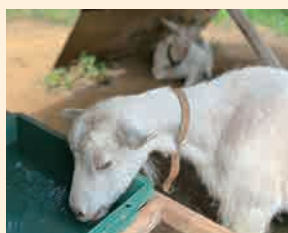
暑い日、ヤギもしっかり水分補給をしています

このヤギたちは、東京芸大の学生や教職員、地域住民の有志、TAPで構成されるチーム「ヤギの目」のメンバー。「ヤギの目」は、日々のヤギの飼育や環境整備活動への関わりを通じて、さまざまな立場の人やヤギとともに、新しい芸術活動や地域のあり方を考えていく活動をしています。月1回以上参加できる人であれば、誰でも参加できます。