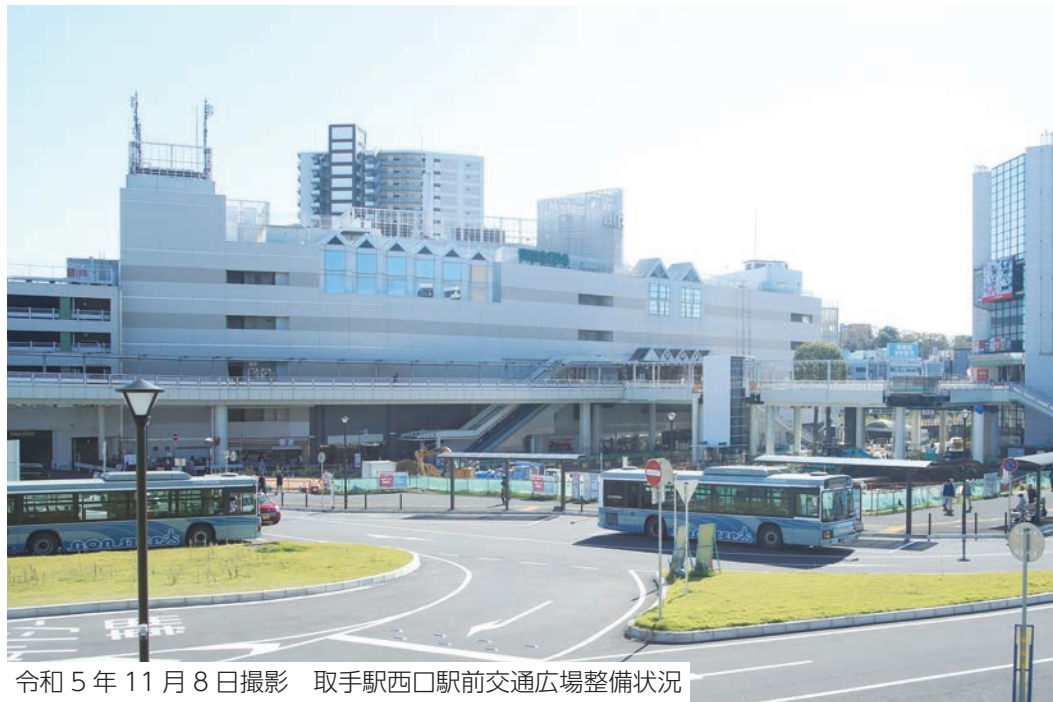
令和5年11月8日撮影 取手駅西口駅前交通広場整備状況