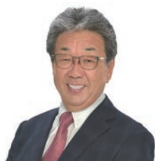
取手市長 中村 修

4月に市長に就任し、私は、「住み続けるほど好きになる街をつくる!!」この思いのもと、市民の方々はもとより、若い子育て世代を中心とした方々が取手市を住まいとして選び、住み続けたい、そのようなまちにしたいと考えています。