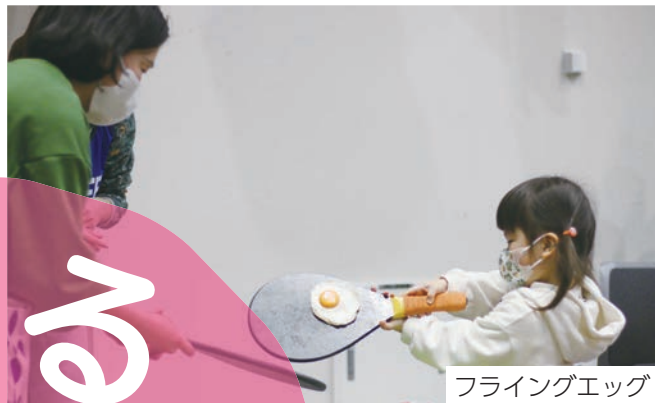
フライングエッグ