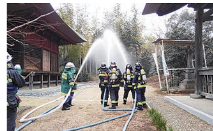
東漸寺での消防訓練の様子(令和2年)