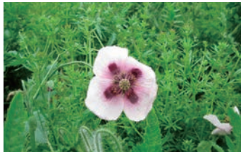
アツミゲシ(セティゲルム種)