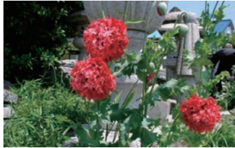
ケシ(ソムニフェルム種)