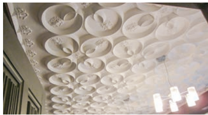
▲甚吉邸食堂の天井

一般公開は不定期に開催予定で、今回は5回目の一般公開となります。※次回は8月の開催予定です。 時 6月13日(木)～15日(土) 各日①10:00～②13:00～③15:30～ 所 前田建設工業ICI総合センター(寺田5270)敷地内 定 各回先着20人 申 甚吉邸運営局(前田建設工業内)専用申込フォームから:5月20日(月)12:00～ 締 6月3日(月)12:00 問 埋蔵文化財センター ☎73-2010 ※甚吉邸運営局は、メールのみ受け付け(ici@jcity.maeda.co.jp)