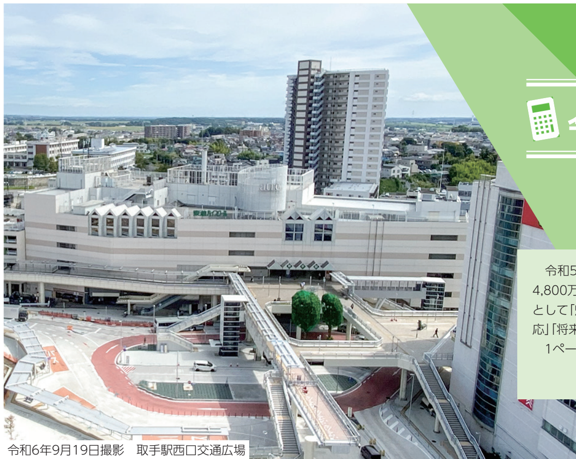
令和6年9月19日撮影 取手駅西口交通広場