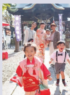
前回最優秀賞作品 七五三