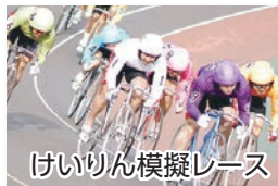
けいりん模擬レース